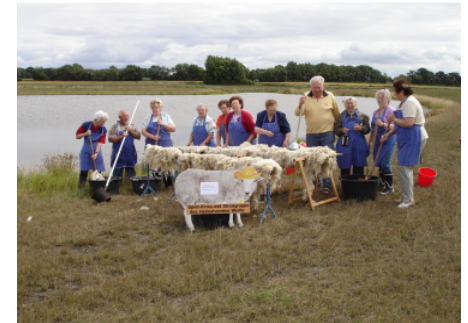
Wollwaschtage der „Spinn-u. Krassgruppe“