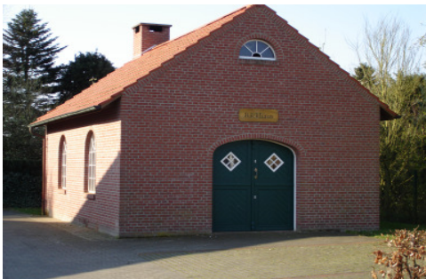
„Backhaus“ in der Nähe des Heimathauses

Zwischenzeitlich ist ein schöner Park entstanden, der ein beliebtes Ausflugsziel ist und zum Verweilen einlädt.