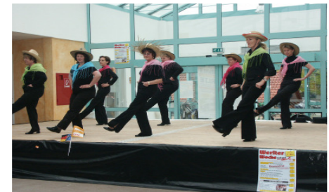
„Tanz- und Folkloregruppe“